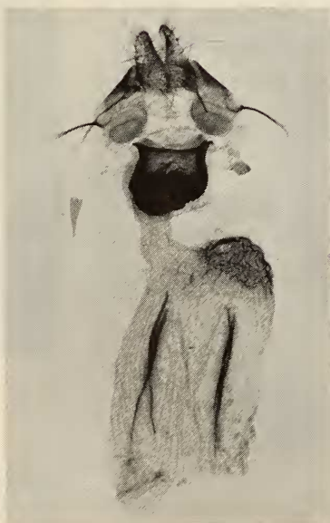
Fig. 1. Auchmis hannemanni n. sp. Holotype ♂.